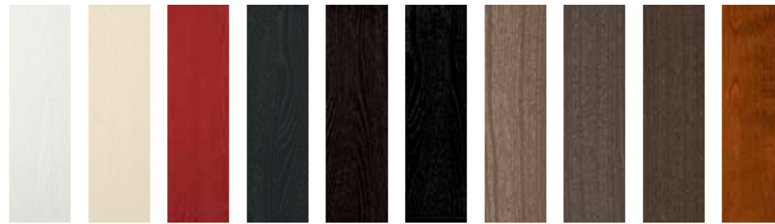
laccato bianco su legno laccato avorio su legno laccato rosso rubino su legno laccato ghisa su legno laccato moka su legno laccato nero su legno laccato bronzo su legno laccato ardesia su legno laccato rame su legno impiallacciato ciliegio

A fine composizione il lato esterno dei fianchi dei fusti costituiti con agglomerati di legno, può essere personalizzato utilizzando il "fianco impiallacciato". Questo viene ricoperto da una lacca colorata proprio come i frontali della cucina. Nel caso della variante in ciliegio, può essere richiesto il fianco del fusto rivestito con lo stesso legno utilizzato per fare i frontali della cucina. Queste personalizzazioni permettono di avere una uniformità di tonalità e di materiali in tutte le parti a vista della composizione, per ottenere un perfetto abbinamento cromatico.