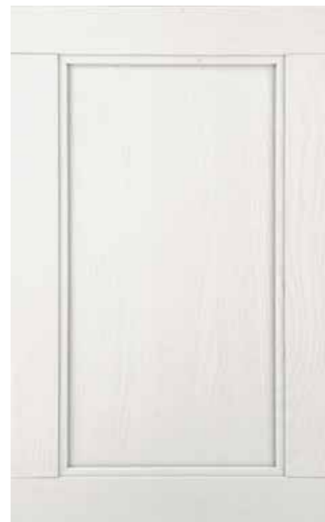
BIANCO di serie

Традиция, увлеченность и более чем 30-летний опыт работы позволили фирме ASTRA узнать дерево и его характеристики, чтобы предложить готовую продукцию превосходного качества. Дверца из ЯСЕНЯ обрабатывается специальной щеткой, чтобы подчеркнуть текстуру, а затем покрывается цветным лаком, который окрашивает, но не скрывает текстуру, делая древесину еще более ценной и яркой. Действительно, нанесение краски на дерево ясеня только усиливает его текстуру, в равновесии между дизайном и традицией. Решение использовать древесину ясеня свидетельствует об однозначном стремлении фирмы ASTRA к использованию пород дерева, происходящих не из первичного леса, а из специально созданных лесных насаждений, в которых установлено равновесие между рубкой и посадкой деревьев.