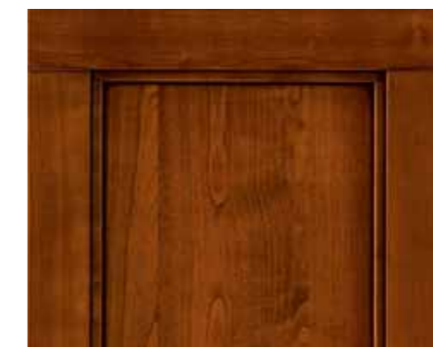
CILIEGIO - solo California