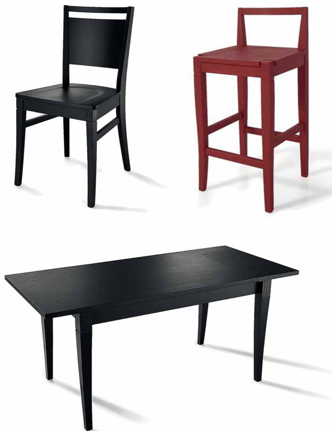
Tavolo 140 x 80 cm. – allungato 174 x 80 cm. Tavolo 160 x 80 cm. – allungato 194 x 80 cm.

Tavoli, sedie e sgabelli "TIME" sono realizzati in legno laccato, per accompagnare con gusto e con equilibrio la cucina in tutte le sue tonalità