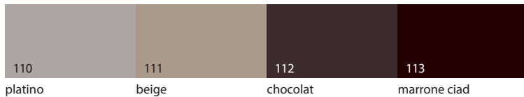
110 platino 111 beige 112 chocolat 113 marrone ciad

* LACCATO LUCIDO SP.30 MM . GLOSSY LACQUERED ONE SIDE TH.30 MM . LACADO BRILLO ESP.30 MM . LAQUÉ BRILLANT ÉP.30 MM