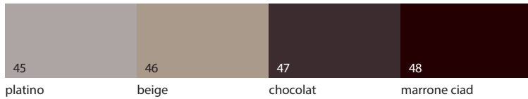
45 platino 46 beige 47 chocolat 48 marrone ciad

* LACCATO OPACO SP.30 MM . MAT LACQUERED TH.30 MM . LACADO MATE ESP.30 MM . LAQUÉ OPAQUE ÉP.30 MM